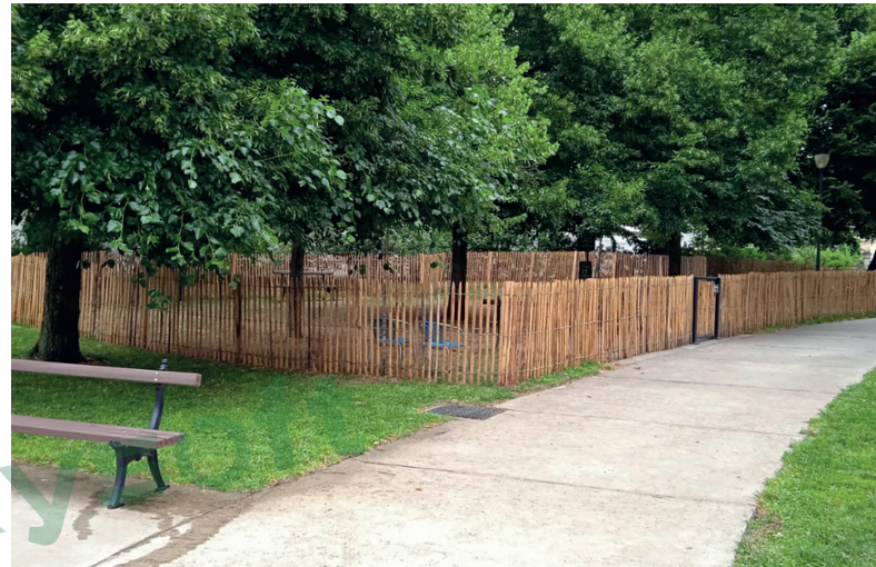
> Au jardin des Barrières, l'allée du chien agrandie et réaménagée

S 'inscrivant dans le cadre de la politique municipale en faveur de la condition animale, le doublement de la surface de l'allée du chien du jardin des Barrières permet également de répondre aux besoins exprimés par ses usagers, désireux de jouir d'une allée plus grande. Réalisé en mai dernier, l'aménagement a été complété par l'installation de mobilier. Ont ainsi été installés une corbeille, deux distributeurs de sacs à déjections canines (ces dernières doivent en effet être ramassées, même dans les parcs canins) et une fontaine à boire mixte offrant deux systèmes d'accès à l'eau différenciés pour l'homme et l'animal, via un dispositif spécial permettant de boire à hauteur. Les quatre bancs existants ont, quant à eux, été repositionnés. La clôture en ganivelle sera végétalisée à l'automne avec une quinzaine de plantes grimpantes. La mise en accessibilité d'une des deux entrées de cette allée du chien fait d'elle la première de la ville accessible aux personnes à mobilité réduite. ■