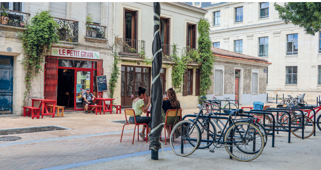
> Un revêtement non bitumineux recouvre dorénavant la place Dormoy qui comptera bientôt cinq arbres supplémentaires.