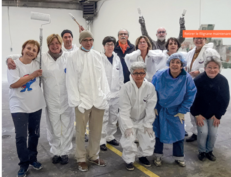
> Une partie de l'équipe de bénévoles, qui a elle-même repeint le local.