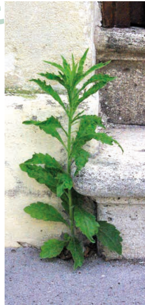
> Cette vergerette du Canada ( erigeron canadensis ) est un excellent anti-inflammatoire et antirhumatismal.

• Dimanche 1 er mai, samedis 9 juillet et 3 septembre de 10 h à 12 h Inscription auprès de Laurent Cerciati : 06 76 61 73 72