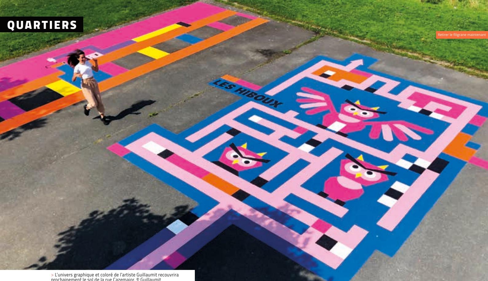
> L'univers graphique et coloré de l'artiste Guillaumit recouvrira prochainement le sol de la rue Cazemajor. © Guillaumit